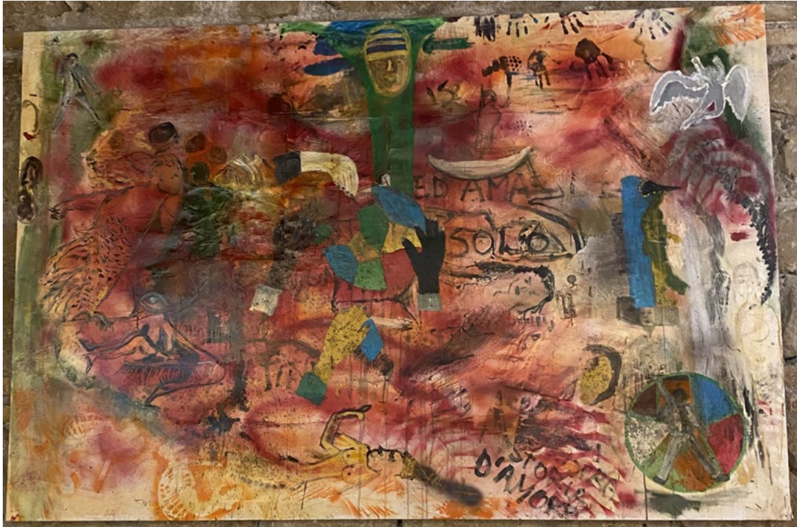
Anima mundi Acrilico su tela 200x140 cm 2017