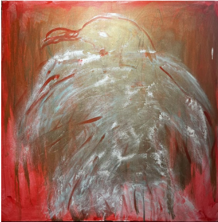
Uccello che si volta Acrilico su tela 100x100 cm 2020