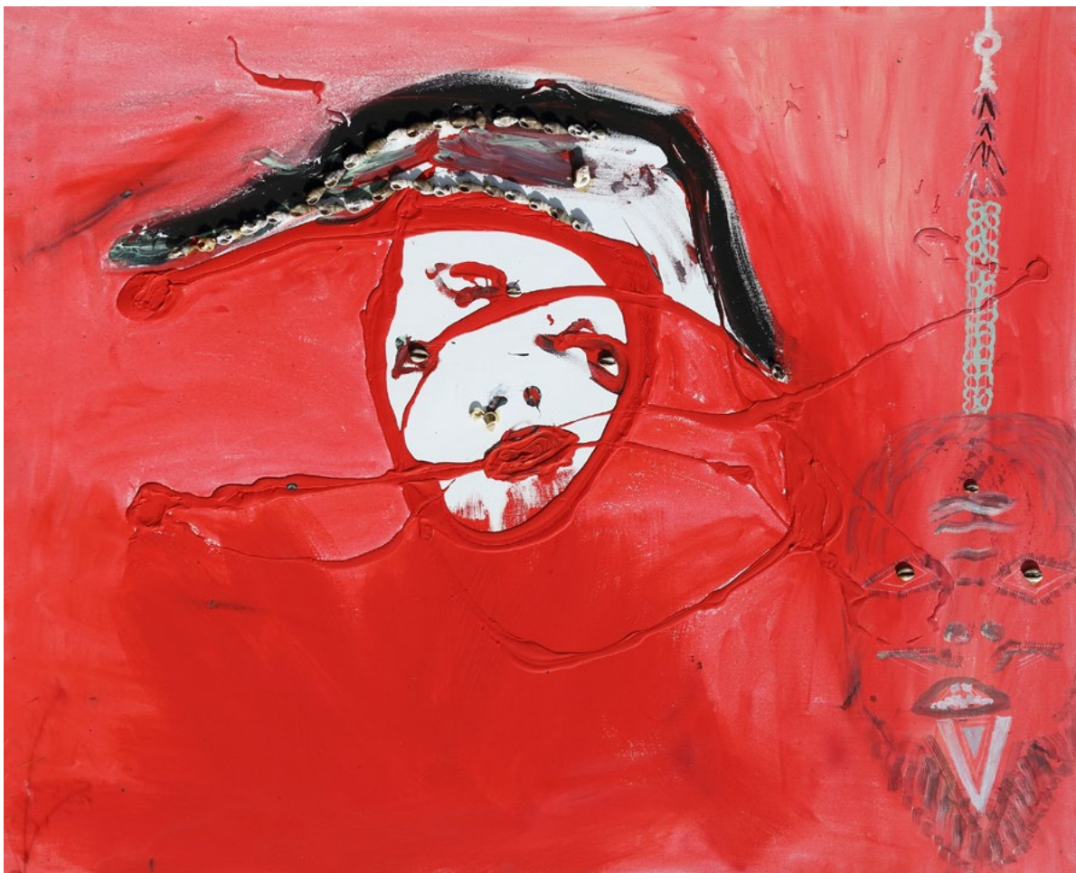
Napoleon Acrilico e conchiglie su tela 120x100 cm 2022