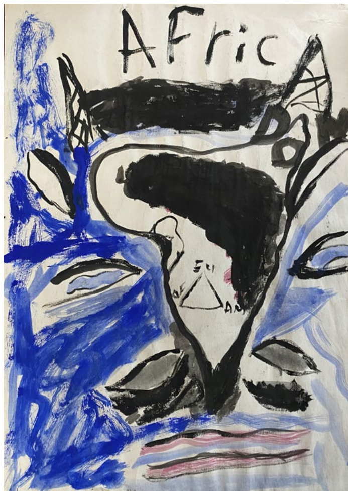
Senza titolo Acquerello su carta 21x29 cm 2023