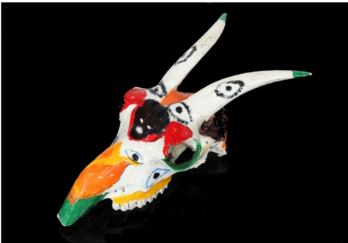
Senza titolo Cranio di capra e colori acrilici 15x30 cm 2023