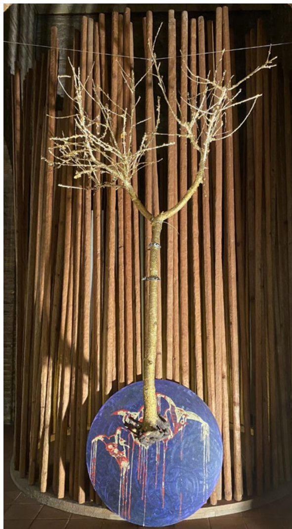
MAAD "Bosco Sacro" I morti non sono morti Albero dorato 190x6x30 Acrilico su tondo 95 cm diametro 2023