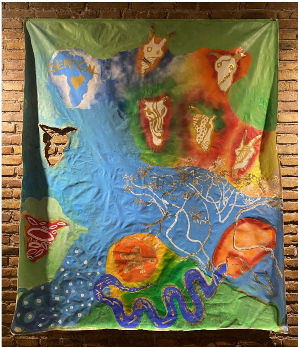
Jaan Ji Acrilico su tela 170x210 cm 2023