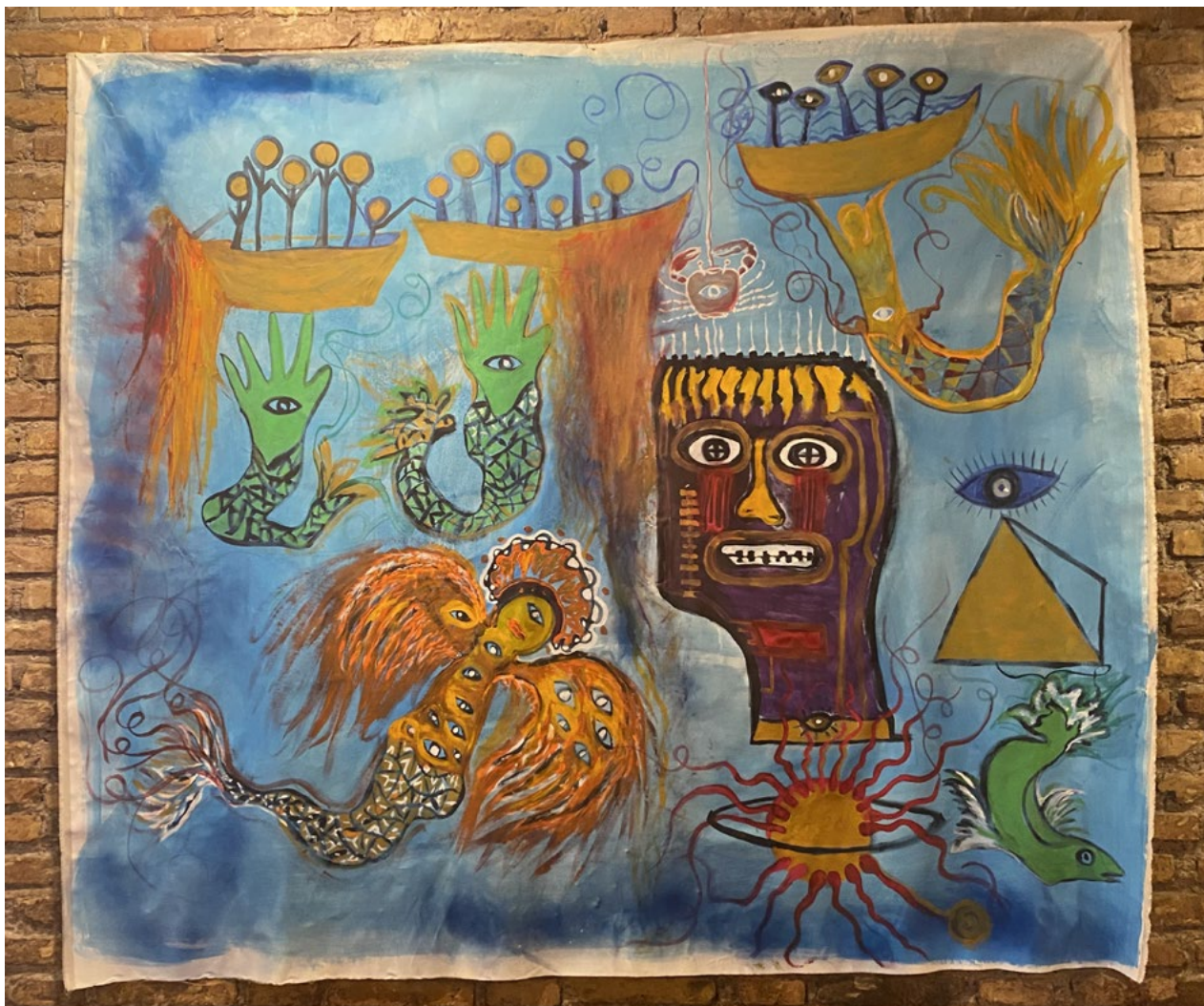
Lerew - Sirena Acrilico su tela 200x180 cm 2023