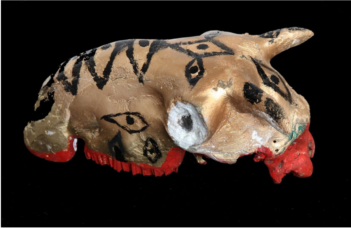
Senza titolo Cranio di capra e colori acrilici 18x20 cm 2023