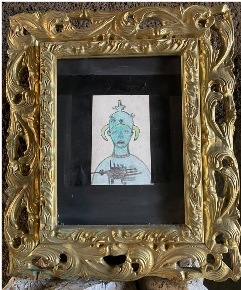
Senza titolo Pastelli a cera su carta in cornice barocca 24x26 cm 2018