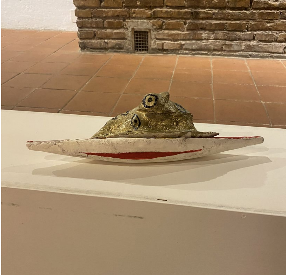
Senza titolo Cranio di capra e colori acrilici Barca in legno dipinta 12x46 cm 2023