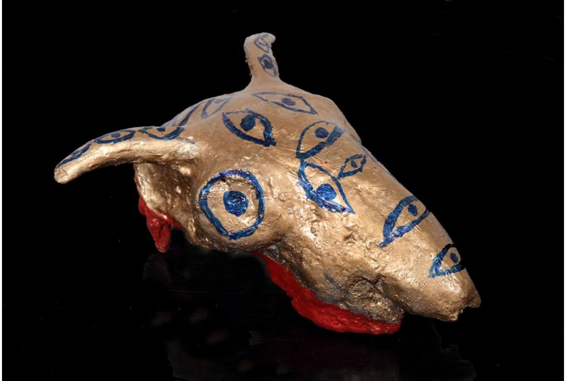
Senza titolo Cranio di capra e colori acrilici 18x20 cm 2023