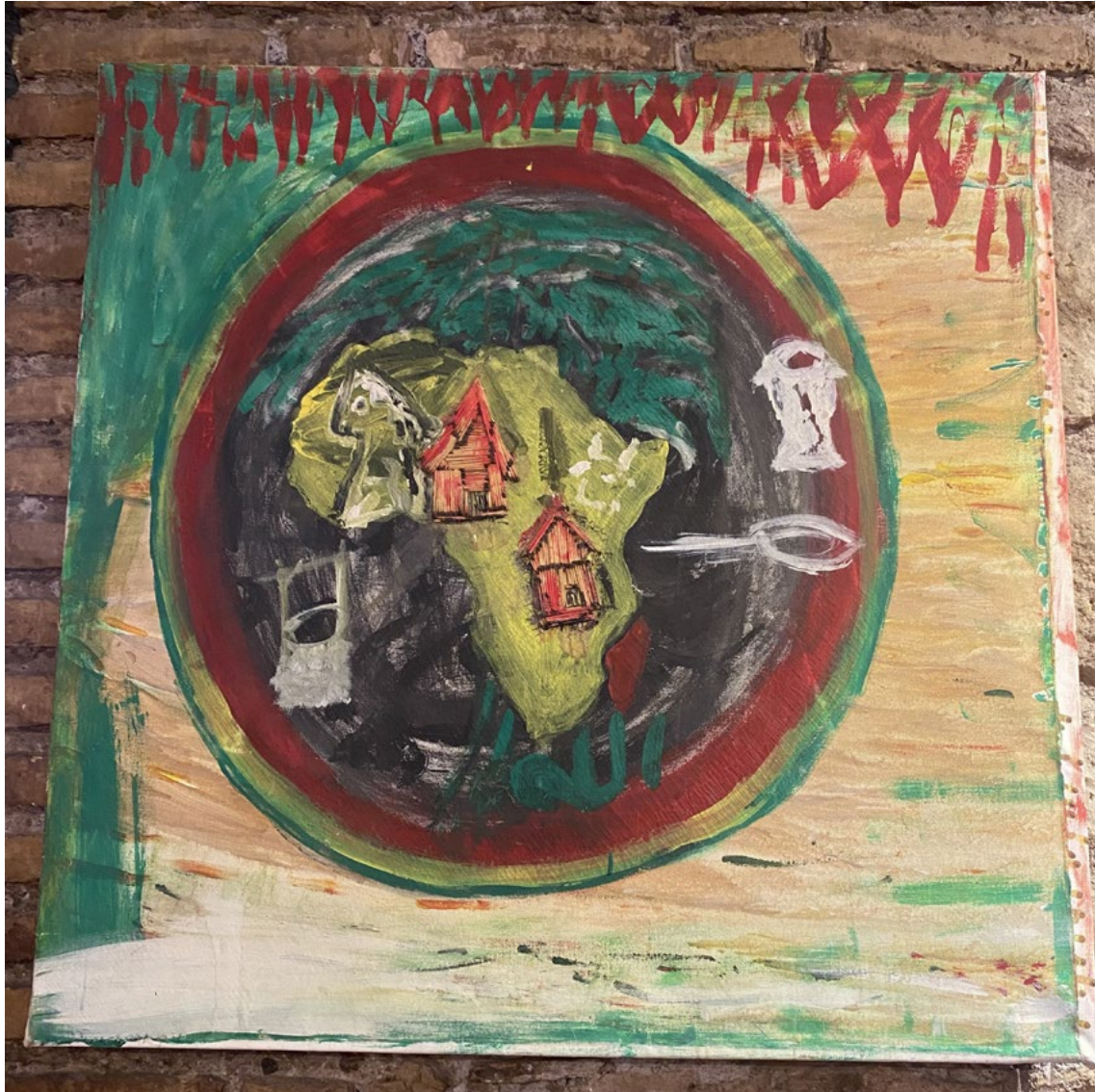
Africa souma rewe Acrilico su tela 100x100 cm 2020