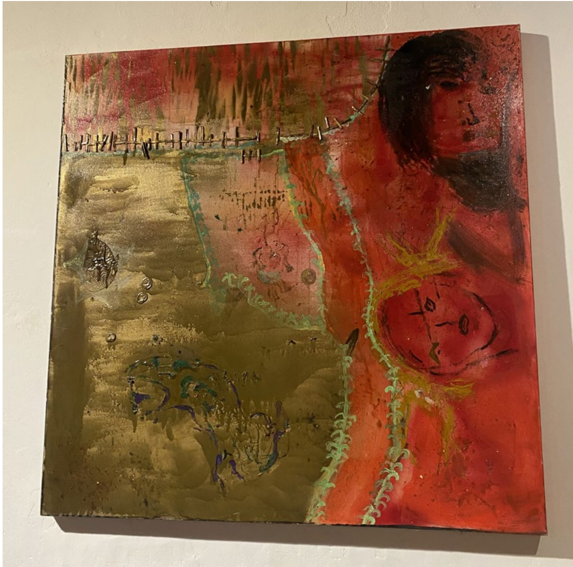
Timis dekk Acrilico su tela 100x100 cm 2020