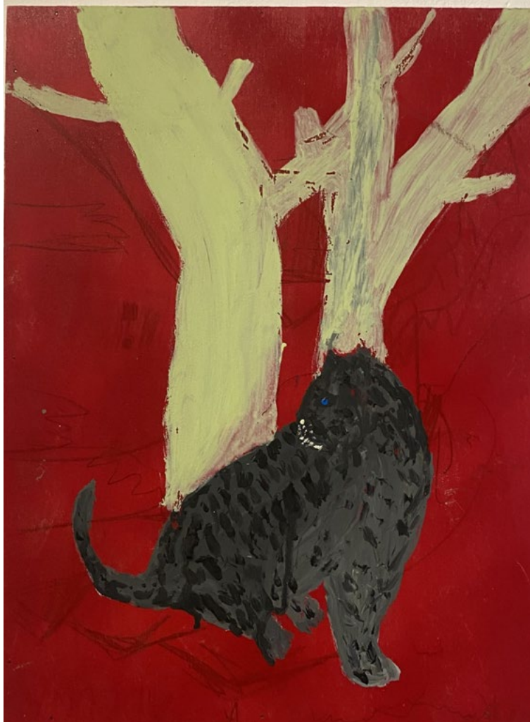
SEGG MI (pantera) Acrilico su tavola 30x40 cm 2023